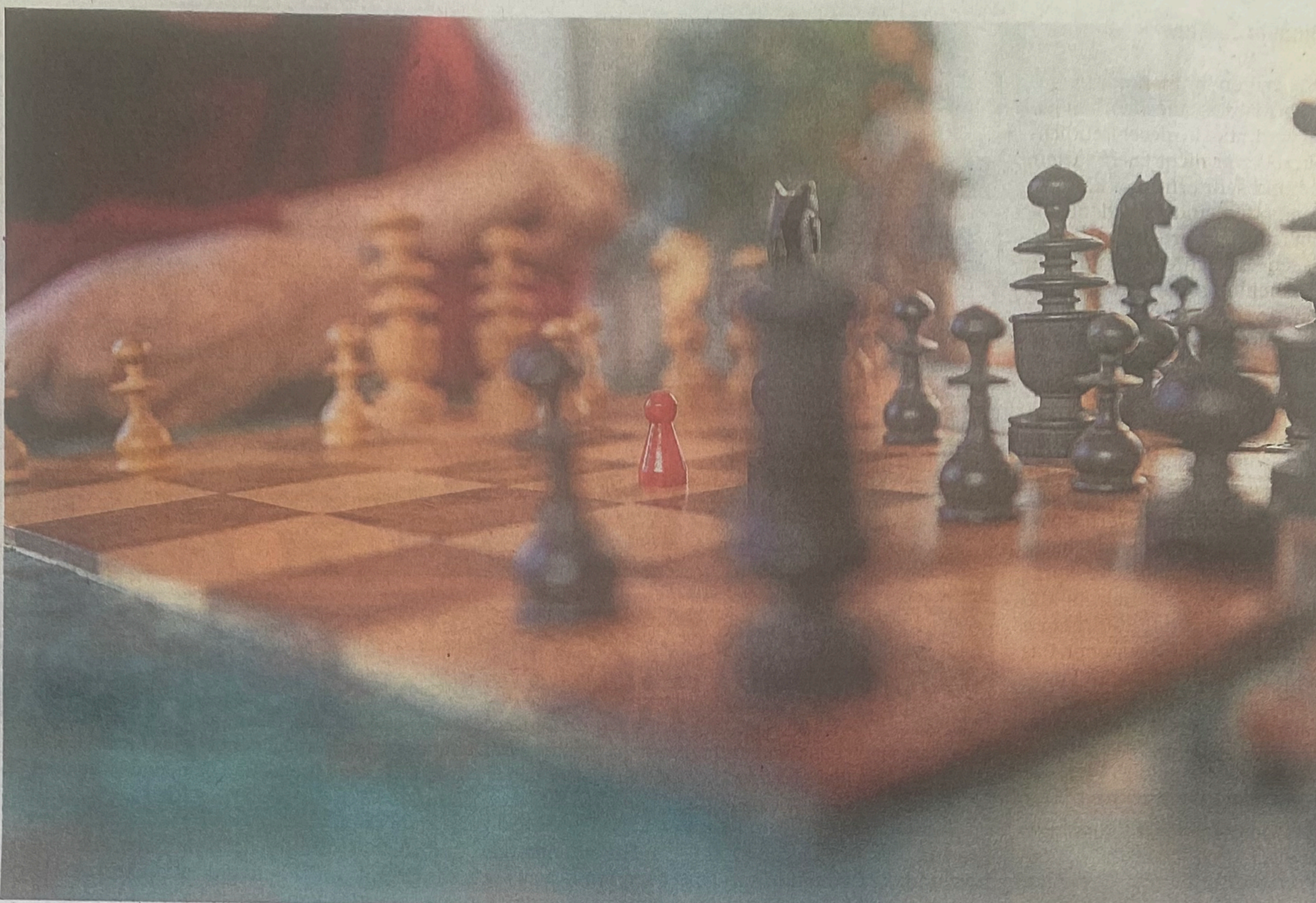
Beliebter Denksport Schach. Im Winzerort Spiez wird seit einem Dreivierteljahrhundert klubmässig gespielt.

Spiez Im Ort wird seit 75 Jahren Schach gespielt. Morgen kommt es zu einer öffentlichen Simultanpartie mit der Schweizer Meisterin gegen 20 Aktive und Promis.